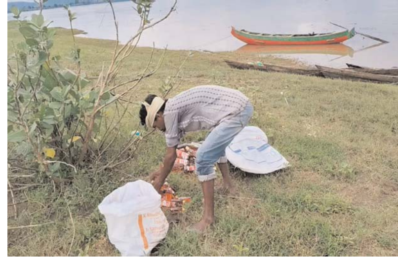
అధ్యక్ష సమాచారం జూన్ 25 మంచిర్యాల ప్రతినిధి:

వేపనపల్లి మండలం మహారాష్ట్ర సరిహద్దు ప్రాంతం కావడంతో మండల కేంద్రంలోని మధ్యం విక్రయ కేంద్రం నుంచి మధ్యం అక్రమంగా సరిహద్దులు దాటుతూనే ఆరోపణలు వ్యక్తమవుతున్నాయి. గోదావరి నదిలో నాలు పడవలను వినియోగించి లక్షల రూపాయల విలువైన మద్యాన్ని మహారాష్ట్ర ప్రాంతాలకు తరలిస్తున్నట్లు స్థానికులు చెబుతున్నారు. మండల కేంద్రంలోని మధ్యం విక్రయ కేంద్రంలో వినియోగదారులు కోరుకున్న ఫ్రాంట్లు అందుబాటులో లేకపోతుండగా, అదే మధ్యం పొరుగు రాష్ట్రంలో అధిక ధరలకు విక్రయిస్తున్నట్లు ప్రచారం జరుగుతోంది. ఈ అక్రమ రవాణా వెనుక కొందరు ప్రభావశీలుల అండ ఉందని పలువురు ఆరోపిస్తున్నారు. సరిహద్దు ప్రాంతాల్లో మధ్యం అక్రమ రవాణా నిరంతరం సాగుతున్నప్పటికీ సంబంధిత శాఖల పర్యవేక్షణ కనిపించడం లేదని ప్రజలు విమర్శిస్తున్నారు. ఈ వ్యవహారంపై సమగ్ర విచారణ చేపట్టి బాధ్యులపై కఠిన చర్యలు తీసుకోవాలని స్థానికులు కోరుతున్నారు.