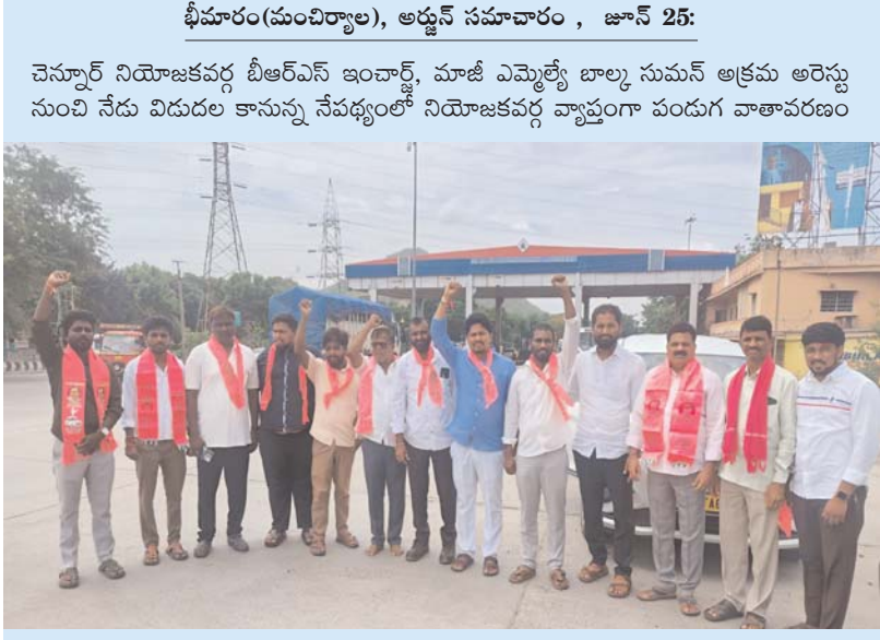
భీమారం(మంచెర్రాల), అడ్వన్ సమాచారం, జూన్ 25: