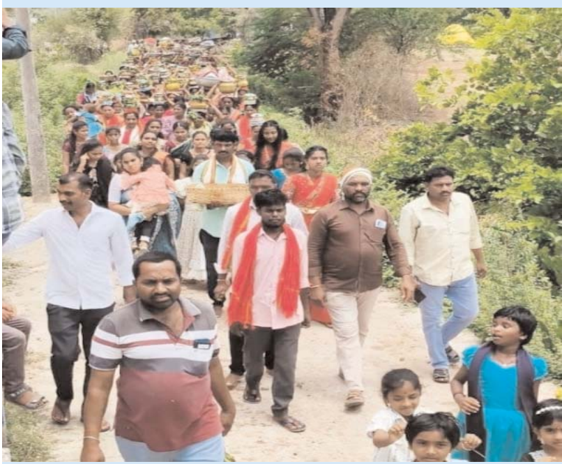
పెద్దమ్మ ప్రతినిధి, అడ్వన్ సమాచారం, జూన్ 25:

కమాన్వెల్త్ మండలంలోని పెంచెర్రాలపేట గ్రామంలో ముదిరాజుల ఆరాధ్య దైవమైన పెద్దమ్మ తల్లికి గురువారం బోనాల వేడుకలను ఘనంగా నిర్వహించారు. గ్రామంలోని 220 ముదిరాజ్ కుటుంబాలకు చెందిన భక్తులు సంప్రదాయబద్ధంగా బోనాల సమర్పించి ప్రత్యేక పూజలు నిర్వహించారు. వర్షాకాలం ప్రారంభంలో ప్రతి సంవత్సరం పెద్దమ్మ తల్లికి బోనాల సమర్పించడం ఆనవాయితీగా కొనసాగుతోందని గ్రామ పెద్దలు తెలిపారు. ఉదయం గ్రామంలో జోగు తిరిగి సేకరించిన బియ్యంతో బోనం సిద్ధం చేసి అమ్మవారికి సమర్పిస్తూ మొక్కులు చెల్లించుకున్నారు. అనంతరం గ్రామంలోని ముదిరాజ్ మహిళలు తమ ఇళ్ల నుంచి డబ్బుల చప్పుళ్ల నడుమ నెత్తిపై బోనాలు మోసుకుని ఊరేగింపుగా వెళ్లి పెద్దమ్మ తల్లికి సమర్పించారు. ఈ సందర్భంగా పంటలు సమృద్ధిగా పండాలని, గ్రామ ప్రజలంతా ఆయురారోగ్యాలతో సుఖసంతోషాలతో ఉండాలని అమ్మవారిని ప్రార్థించారు. కార్యక్రమంలో ముదిరాజ్ కుల బాంధవులు పెద్ద సంఖ్యలో పాల్గొన్నారు. అనంతరం సహపంక్తి భోజనాలు నిర్వహించారు.