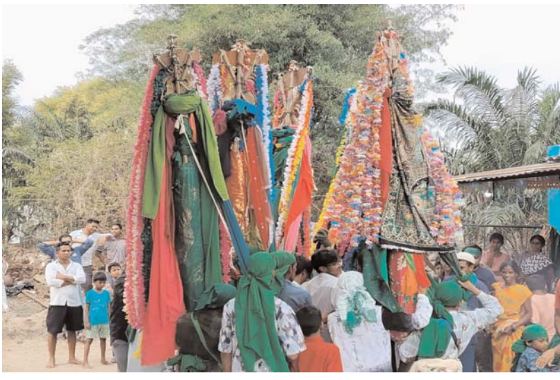
పెద్దపల్లి ప్రతినిధి, అధ్యక్ష సమాచారం, జూన్ 25:

కమాన్ పూర్ మండలంలోని పలు గ్రామాల్లో మొహరం వేడుకలు వైభవంగా కొనసాగుతున్నాయి. మొహరం వినిమిదో రోజు సందర్భంగా గుండారం, జాలపల్లి, పేరాపల్లి, రొంపికుంట, నాగారం తదితర గ్రామాల్లో పీరీల ఊరేగింపులు ఘనంగా నిర్వహించారు. ఉదయం పీరీలను లేపి దప్పుల వాయిద్యాల నడుమ గ్రామ వీధుల గుండా ఊరేగించారు. భక్తులు పెద్ద సంఖ్యలో పాల్గొని పీరీల వద్ద మొక్కులు చెల్లించుకున్నారు. కులమతాలకు అతీతంగా ప్రజలు వేడుకల్లో పాల్గొని భక్తిశక్తులు చాటుకున్నారు. శుక్రవారం గ్రామాల్లో మాతీలను తీసి పీరీల వద్ద సమర్పించుకున్నట్లు నిర్వాహకులు తెలిపారు. జనవారంతో మొహరం వేడుకలు ముగియనున్నాయి.