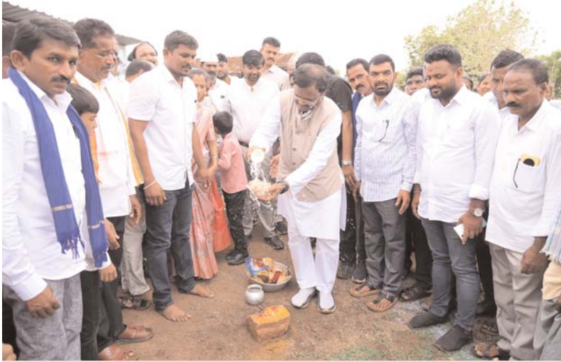
అధ్యక్ష సమాచారం జూన్ 23 మంచినీటి ప్రతినిధి:

కోటపల్లి మండలంలో రూ.60 లక్షల అభివృద్ధి పనులకు శంకుస్థాపన!