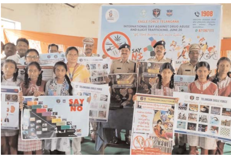
పెద్దపల్లి ప్రతినిధి, అధ్యక్ష సమాచారం, జూన్ 23: