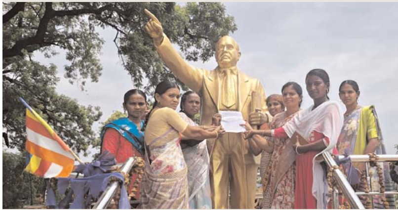
అర్జున్ సమాచారం జూన్ 23 మంచిర్యాల ప్రతినిధి:

అంబేద్కర్ విగ్రహం వద్ద వినతిపత్రం సమర్పణ.. జూలై 1 నుంచి నిరవధిక సమ్మెకు సన్నాహాలు: