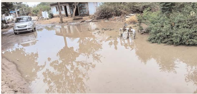
పెద్దపల్లి ప్రతినిధి, అర్జున్ సమాచారం, జూన్ 23

ముత్తారం మండలంలోని పోతారం గ్రామంలో సోమవారం రాత్రి కురిసిన స్వల్ప వర్షానికి ప్రధాన రహదారి చెరువును తలపించేలా నీటితో నిండిపోయింది. గ్రామంలోకి ప్రవేశించే ప్రధాన రహదారిపై వర్షపు నీరు నిల్వ ఉండడంతో ప్రజలు తీవ్ర ఇబ్బందులు ఎదుర్కొంటున్నారు. రహదారిపై నీరు నిలిచిపోవడంతో వాహనాల రాకపోకలకు ఆటంకం ఏర్పడటంతో పాటు పాదచారులు కూడా అవసరాలు పడుతున్నారు. ప్రతి చిన్న వర్షానికే ఇదే పరిస్థితి నెలకొంటోందని గ్రామస్థులు ఆవేదన వ్యక్తం చేస్తున్నారు. సంబంధిత అధికారులు వెంటనే స్పందించి రహదారిపై నిలిచిన వర్షపు నీటిని తొలగించడంతో పాటు శాశ్వత పరిష్కారానికి తగిన శ్రద్ధతో వ్యవస్థ ఏర్పాటు చేయాలని గ్రామ ప్రజలు కోరుతున్నారు.