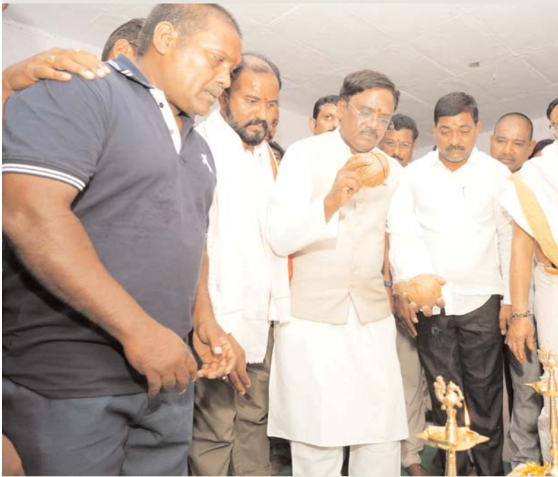
సమాచారం జూన్ 22 మంచిర్యాల, ప్రాంతీయ ప్రతినిధి:

మంచిర్యాల జిల్లా, క్యాతన్ పల్లి క్యాతన్ పల్లి మున్సిపాలిటీలోని 9వ వార్డులో ఆరేకీమీ కూడలి వద్ద నూతనంగా ఏర్పాటు చేసిన శ్రీ మారుతి శక్తి వ్యాయామశాలను రాష్ట్ర కార్మిక, ఉపాధి, గసుల శాఖ మంత్రి డాక్టర్ జి. వివేక్ వెంకటస్వామి ప్రారంభించారు. ఈ సందర్భంగా మంత్రి మాట్లాడుతూ యువత ఆరోగ్యవంతమైన జీవన విధానాన్ని అలవర్చుకోవడంలో వ్యాయామానికి ఎంతో ప్రాధాన్యం ఉందన్నారు. శారీరక దృఢత్వం పెంపొందించడంలో పాటు మానసిక ఉల్లాసాన్ని కలిగించడంలో వ్యాయామశాలలు కీలక పాత్ర పోషిస్తాయని పేర్కొన్నారు. యువత వ్యాయామం, క్రీడల పట్ల ఆసక్తి పెంచుకుని ఆరోగ్యకర సమాజ నిర్మాణంలో భాగస్వాములు కావాలని పిలుపునిచ్చారు. అనంతరం వ్యాయామశాలలో ఏర్పాటు చేసిన ఆధునిక పరికరాలను పరిశీలించి నిర్వాహకులను అభినందించారు. కార్యక్రమంలో స్థానిక ప్రజాప్రతినిధులు, పార్టీ నాయకులు, యువకులు, అభిమానులు భారీ సంఖ్యలో పాల్గొన్నారు.