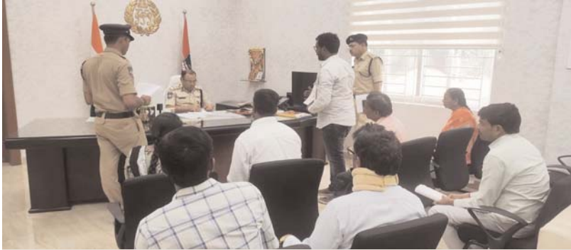
పెద్దపల్లి ప్రతినిధి, అర్జున్ సమాచార, జూన్ 22: