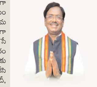
అధ్యక్ష సమాచారం, ఖీమారం(మంచిర్యాల), జూన్ 22:

చెన్నూరు నియోజకవర్గ ప్రజల సమస్యలను నేరుగా తెలుసుకొని పరిష్కరించే లక్ష్యంతో ప్రత్యేక కార్యక్రమం నిర్వహించనున్నారు. ఈ కార్యక్రమంలో ప్రజలు తమ సమస్యలు, వినతులు, అభ్యర్థనలను నేరుగా శాసనసభ్యుడు గడ్డం వివేక్ వెంకటస్వామికి తెలియజేసే అవకాశం కల్పించారు. జూన్ 23వ తేదీ మంగళవారం ఉదయం 8 గంటల నుంచి 9 గంటల వరకు 9490700870 దూరవాణి సంఖ్యకు కాల్ చేసి శాసనసభ్యునితో మాట్లాడవచ్చు. ప్రజలు నిర్దేశించిన తేదీ, సమయాల్లో మాత్రమే సంప్రదించాలని నిర్వాహకులు కోరారు. ప్రజా సమస్యల పరిష్కారానికి ఈ కార్యక్రమం ఉపయోగపడుతుందని తెలిపారు.