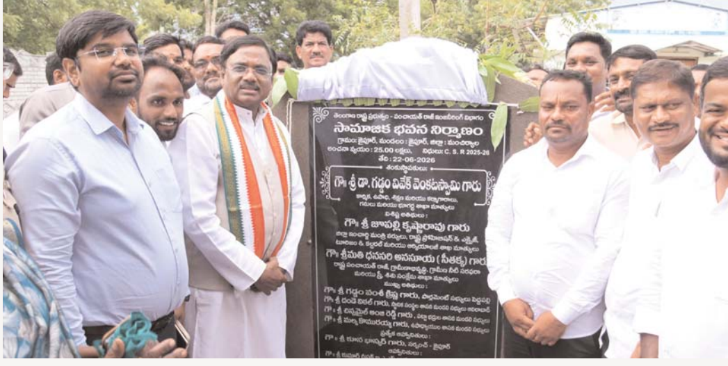
వివిధ శాఖల అధికారులు, ప్రజాప్రతినిధులు, స్థానిక నాయకులు, గ్రామస్థులు పాల్గొన్నారు.

జైపూర్ మండల కేంద్రంలో రూ.25 లక్షల వ్యయంతో నిర్మించనున్న నూతన సామాజిక భవనానికి రాష్ట్ర కార్మిక, ఉపాధి, గసుల శాఖ మంత్రి డా. జి. వివేక్ వెంకటస్వామి సోమవారం భూమిపూజ నిర్వహించారు. సంస్థల సామాజిక బాధ్యత నిర్ధారణ ద్వారా చేపడుతున్న ఈ నిర్మాణం గ్రామ ప్రజలకు ఉపయోగకరంగా నిలుస్తుందని మంత్రి తెలిపారు. గ్రామీణ ప్రాంతాల్లో సామాజిక, సాంస్కృతిక కార్యక్రమాల నిర్వహణకు ఇటువంటి భవనాలు ఎంతో దోహదపడతాయని పేర్కొన్నారు. ప్రజల అవసరాలను దృష్టిలో ఉంచుకుని అభివృద్ధి పనులను ముందుకు తీసుకెళ్తున్నట్లు చెప్పారు. భవన నిర్మాణ పనులను నాణ్యతా ప్రమాణాలతో, నిర్ణీత గడువులో పూర్తి చేసి ప్రజలకు అందుబాటులోకి తీసుకురావాలని సందర్భంలో అధికారులకు ఆదేశించారు. ఈ భవనం ద్వారా సమాజీకాలు, సామాజిక కార్యక్రమాలు, ప్రజా అవసరాలకు సంబంధించిన అనేక కార్యక్రమాలు నిర్వహించుకునే అవకాశం కలుగుతుందని తెలిపారు. ఈ కార్యక్రమంలో జిల్లా కలెక్టర్ కుమార్ డివేక్, వివిధ శాఖల అధికారులు, ప్రజాప్రతినిధులు, స్థానిక నాయకులు, గ్రామస్థులు పాల్గొన్నారు.