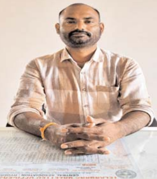
అధ్యక్ష సమాచారం, ఖీమారం(మంచిర్యాల), జూన్ 22:

రానున్న వానాకాలం సాగు సీజన్ను దృష్టిలో ఉంచుకుని ఖీమారం మండలంలోని రైతులకు నాణ్యమైన పరిమరీ ఇతర విత్తనాలను అందుబాటులో ఉంచేందుకు ప్రత్యేక విత్తన మేళాను నిర్వహిస్తున్నట్లు వ్యవసాయ శాఖ అధికారులు ఒక ప్రకటనలో తెలిపారు. ఈ విత్తన మేళాను జూన్ 23 నుండి 30 వరకు (ఎనిమిది రోజుల పాటు) ఖీమారం మండల కేంద్రంలోని రైతు వేదిక లో నిరంతరంగా కొనసాగుతాయని పేర్కొన్నారు. ప్రభుత్వం బోనస్ కు చెసిన ఏడు పరి రకాలైన -చీ= 15048, డీూ 5204, ఖబీవీ 1638, ఎమ్ సోనా, జై శ్రీరామ్, జె+ూ 44 మరియు ఖబీవీ 7715 విత్తనాలను పాటు నానో డిపి మరియు యూరియాను ఉంచుతుంది. ఈ కార్యక్రమంలో విత్తన కంపెనీలు, విత్తన డిస్ట్రిబ్యూటర్లు, విత్తన డీలర్లు మరియు ప్రభుత్వ అనుబంధ సంస్థలతో ఒప్పందం కుదుర్చుకున్న డీలర్లు పాల్గొని రైతులకు అవసరమైన సమాచారం అందించనున్నారు. విత్తనాల ఎంపిక, సాగు కాలం, దిగుబడి సామర్థ్యం, మార్కెట్ అవకాశాలు తదితర అంశాలపై రైతులకు వ్యవసాయ శాఖ అధికారులు, విత్తన సంస్థల ప్రతినిధులు అవగాహన కల్పిస్తారు. రైతులు తమ అవసరాలకు అనుగుణంగా సరైన రకాన్ని ఎంపిక చేసుకునేందుకు ఈ విత్తన మేళాలు ఉపయోగపడతాయి. రైతులు దళారులను సమీక్షించుకుంటే, తమ భూములకు మరియు అవసరాలకు అనుగుణంగా సరైన విత్తన రకాలను ఎంపిక చేసుకునేందుకు ఈ మేళా ఒక మంచి అవకాశం. కావున ఖీమారం మండలంలోని రైతాంగం పెద్ద సంఖ్యలో తరలివచ్చి ఈ అవకాశాన్ని సద్వినియోగం చేసుకోవాలని వ్యవసాయ అధికారులు కోరారు.