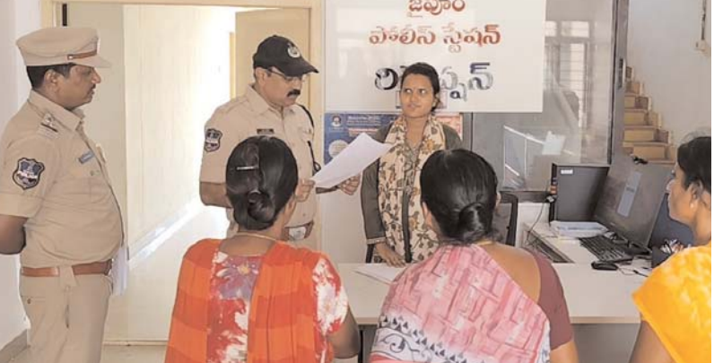
తీసుకోవాలని ఎస్ఐ భూమేశ్వర్ సూచించారు. అనంతరం రిసెప్షన్ రికార్డులను పరిశీలించి వాటి నిర్వహణ తీరును సమీక్షించారు. పోలీస్ స్టేషన్ లో విధులు నిర్వహిస్తున్న అధికారులు, సిబ్బందిని వివరాలు, వారికి కేటాయించిన బాధ్యతలు, చట్టపరిధిలో కార్యకలాపాలకు పాల్పడే వ్యక్తులపై సెకరీటరీని సమాచారాన్ని అడిగి తెలుసుకున్నారు. పోలీస్ స్టేషన్ లో పెండింగ్ లో ఉన్న కేసుల పురోగతి, నేరాల నియంత్రణ, శాంతిభద్రతల పరిరక్షణ కోసం ముందుగా తీసుకుంటున్న చర్యలపై ఎస్ఐతో సమీక్ష నిర్వహించారు. అలాగే శాఖాపరమైన సమస్యలు ఏమైనా ఉన్నాయో అని సిబ్బందిని అడిగి తెలుసుకుని, ప్రజలకు మరింత మెరుగైన సేవలు అందించేలా బాధ్యతాయుతంగా విధులు నిర్వహించాలని సూచించారు.

రామగుండం పోలీస్ కమిషనరేట్ పరిధిలోని జైపూర్ పోలీస్ స్టేషన్ ను మంచిర్యాల డీసీపీ ఎ. భాస్కర్ సోమవారం ఆకస్మికంగా తనిఖీ చేశారు. పోలీస్ స్టేషన్ కు చేరుకున్న డీసీపీ ముందుగా రిసెప్షన్ కేంద్రాన్ని సందర్శించి, అత్యధ ఉన్న బాధితులతో మాట్లాడి వారి సమస్యలను అడిగి తెలుసుకున్నారు. ఫిర్యాదులు స్వీకరించిన వెంటనే చట్టపరిధిలో విచారణ జరిపి తగిన చర్యలు