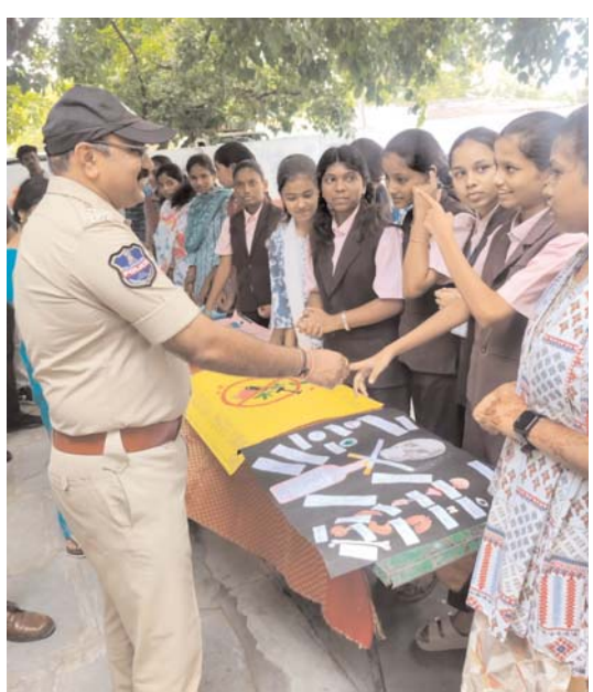
తెలియజేయాలని, అవసరమైతే దర్యా-100 ద్వారా పోలీసులకు సమాచారం ఇవ్వాలని సూచించారు. సమాచారం అందించిన వారి వివరాలను గోప్యంగా ఉంచుతామని భరోసా ఇచ్చారు. మంచి పౌరులుగా ఎదిగి మత్తు పదార్థాలకు దూరంగా ఉండటంతో పాటు సమాజాన్ని కూడా అప్రమత్తం