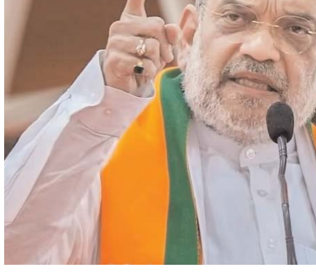
పునరుజ్జీవనం జరుగుతోందని, మహారాష్ట్రలోని అన్ని జ్యోతిర్లింగాలు, శక్తి పీఠాలను ప్రభుత్వం పునరుద్ధరిస్తోందని అమిత్ షా ఈ సందర్భంగా చెప్పారు.

ఎంపీలకు షోకాజ్ వోటీసులు - అసర్వత వేటు హెచ్చరిక