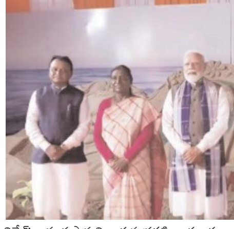
విలేజ్ గా మారుస్తామని ఆయన ప్రకటించారు. ఈ కార్యక్రమం ద్వారా గ్రామంలోని ప్రతి ఇంటికీ సౌరశక్తి అందుతుంది. ఒడిశాలోని ప్రసిద్ధ కోకాబార్, సూర్య దేవాలయానికి ఉన్న గుర్తింపు తరహాలోనే, పహాడ్ పూర్ గ్రామం కూడా ప్రపంచవటంలో పునరుత్పాదక ఇంధన కేంద్రంగా సరికొత్త గుర్తింపును పొందుతుందని ప్రధాని పేర్కొన్నారు.

రాష్ట్రంలో బీజేపీ ప్రభుత్వం రెండేళ్లు పూర్తి చేసుకున్న సందర్భంగా ఒడిశాలోని మయూర్ఖండలో జరిగిన ‘వికాస్ రాధా, ఒడిశా సౌరా’ అవినీ సభలో ప్రధానమంత్రి నరేంద్ర మోదీ పాల్గొన్నారు. ఈ సందర్భంగా ఒడిశా సర్వతోమఖాభివృద్ధి కోసం దాదాపు రూ. 47,000 కోట్ల విలువైన పలు అభివృద్ధి ప్రాజెక్టులకు రాష్ట్రపతి ద్రౌపది ముర్ము, ప్రధాని మోదీ శంకుస్థాపనలు, ప్రారంభోత్సవాలు చేశారు. రాష్ట్రపతి ద్రౌపది ముర్ము జన్మదినం రోజు ఈ కార్యక్రమం జరిగడం విశేషం. రాష్ట్రపతి ద్రౌపది ముర్ము జన్మదినం సందర్భంగా ఆమె న్యూగ్రామమైన పహాడ్ పూర్ ను ప్రధాని మోదీ సందర్శించారు. ఈ గ్రామాన్ని వేగంగా అభివృద్ధి చేసి ‘సోలార్