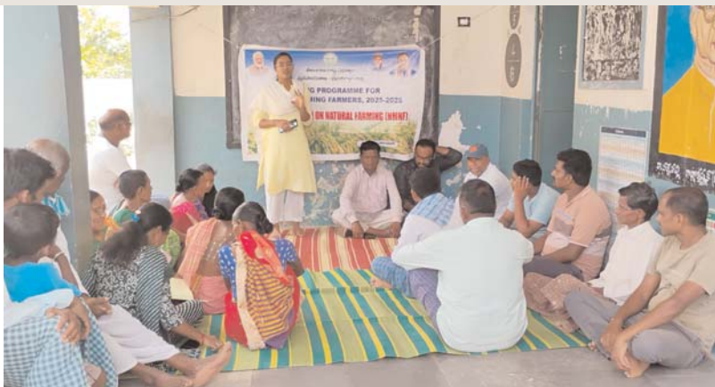
అడ్డున్ సమాచారం జూన్ 19 మంచినీరాల ప్రతినిధి: