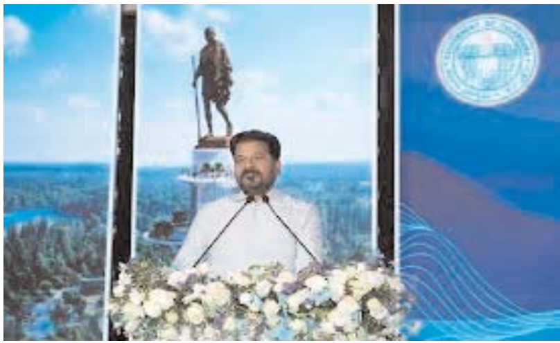
హైదరాబాద్, అర్జున్ సమాచారమ్ ప్రతినిధి

తెలంగాణ ప్రభుత్వం తలపెట్టిన మూసీ రివర్ ప్రాజెక్ట్ అభివృద్ధికి కీలక ముందడుగు పడింది. గాంధీ సరోవర్ ప్రాజెక్ట్ అనుబంధ కేంద్రం నుంచి అధికారిక అనుమతి లభించింది. మూసీ రివర్ ప్రాజెక్ట్ కేంద్ర రక్షణ మంత్రిత్వ శాఖ గ్రీన్ సిగ్నల్ ఇచ్చింది. భాషాభివృద్ధి 'గాంధీ సరోవర్'గా అభివృద్ధి చేయడానికి వర్షానికి పరిష్కార ముందుగా చేసింది. రూ. 533.42 కోట్ల విలువైన 83.81 ఎకరాల డిఫెన్స్ భూమి వినియోగానికి అనుమతిచ్చింది. ఆర్టిలరీ సెంటర్ గోల్కొండ పరిధిలోని భూమిలో అభివృద్ధి పనులకు కేంద్రం క్లియరెన్స్ ఇచ్చింది.