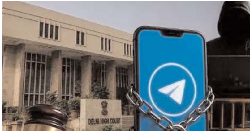
న్యూఢిల్లీ: అర్జున్ సమాచారమ్ ప్రతినిధి

నీట్ పరీక్ష నేపథ్యంలో కేంద్ర ప్రభుత్వం టెలిగ్రామ్ పై తాత్కాలిక నిషేధం విధించడాన్ని ఢిల్లీ హైకోర్టు సమర్థించింది. కేంద్ర ప్రభుత్వ నిర్ణయాన్ని సవాల్ చేస్తూ టెలిగ్రామ్ దాఖలు చేసిన పిటిషన్ ను కొట్టివేసింది. కేంద్ర ప్రభుత్వ నిర్ణయం సరైనదేనని జస్టిస్ తేజస్ కారియా తేల్చి చెప్పారు. కేంద్రం తరఫున సాలిసిటర్ జనరల్ తుషార్ మెహతా వాదనలు వినిపించారు. అక్రమ, చట్టవిరుద్ధ కార్యకలాపాలకు పాల్పడేవారికి టెలిగ్రామ్ ప్రధాన సాధనంగా మారినందున అన్నారు. అనుమానాస్పద ఛానల్స్ పై చర్యలు తీసుకోవాలని గతంలో పలుమార్లు టెలిగ్రామ్ కు సూచించామని అన్నారు. అయినప్పటికీ కంపెనీ తగిన చర్యలు తీసుకోవడంలో విఫలమైందని చెప్పారు. మరోవైపు, టెలిగ్రామ్ తరఫున సీనియర్ న్యాయవాది ప్రభు మెహతా వాదనలు వినిపిస్తూ ఎమ్మెల్యే అధికారంలో నిషేధం విధించడాన్ని కేంద్రం సమర్థించుకోవాలని అన్నారు. సంబంధిత కంటెంట్ ను మాత్రమే బ్లాక్ చేయకుండా మొత్తం యాక్స్ పై ఎందుకు నిషేధం విధించాల్సి వచ్చిందో వివరించలేదని పేర్కొన్నారు. కేవలం నీట్ పరీక్షలో దేశ వార్యులను తప్పించి, సమగ్రతకు ముప్పు ఏర్పడుతుందా? అని ప్రశ్నించారు. అయితే, కోర్టు కేంద్రం వాదనలను సమర్థించింది. సెక్షన్ 69ఏ కింద ఒక డిజిటల్ వేదికను నిషేధించే అధికారం ప్రభుత్వానికి ఉందని జస్టిస్ తేజస్ కారియా స్పష్టం చేశారు. నిషేధం ఎత్తివేత కోరుతూ టెలిగ్రామ్ చేసిన అభ్యర్థనను తిరస్కరించారు. జూన్ 22 వరకూ కేంద్రం టెలిగ్రామ్ పై నిషేధం విధించిన విషయం తెలిసింది.