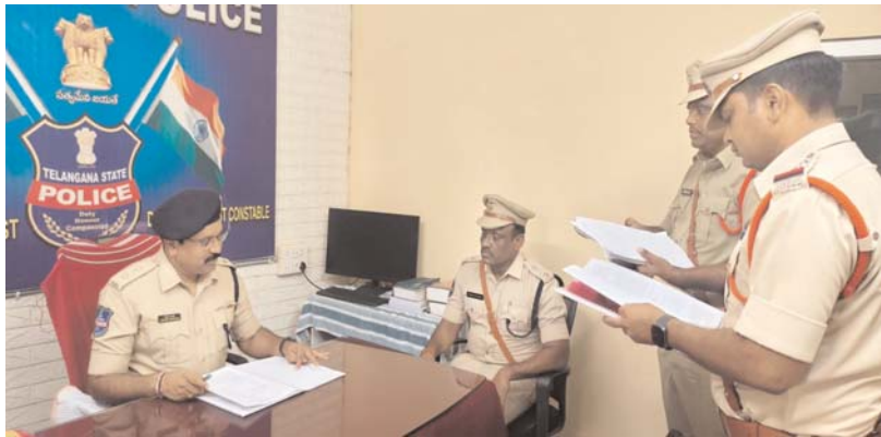
పెద్దపల్లి ప్రతినధి, అడ్డు సమాచారం, జూన్ 18: