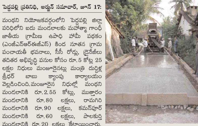
పెద్దపల్లి ప్రతినధి, అడ్వేన్ సమాచార, జూన్ 17:

మంథని నియోజకవర్గంలోని పెద్దపల్లి జిల్లా పరిధిలోని ఐదు మండలాలకు మహాత్మా గాంధీ జాతీయ గ్రామీణ ఉపాధి హామీ పథకం (ఎంజీఎస్ఆర్ఈజీఎస్) కింద సూతన గ్రామ పంచాయతీ భవనాలు, సీసీ రోడ్లు, డ్రైనేజీలు తదితర అభివృద్ధి పనుల కోసం రూ.5 కోట్ల 25 లక్షల నిధులు మంజూరైస్తున్న మంత్రి దుద్దిళ్ల శ్రీధర్ బాబు కార్యక్రమం వెల్లడించింది. మంజూరైన నిధుల్లో మంథని మండలానికి రూ.2.55 కోట్లు, ముత్తూరు మండలానికి రూ.80 లక్షలు, రామగిరి మండలానికి రూ.90 లక్షలు, కమన్వెల్థ్ మండలానికి రూ.60 లక్షలు, పాలకర్తి మండలానికి రూ.20 లక్షలు కేటాయించారు. అదనంగా ముత్తూరు మండలం ధర్మాపూర్ గ్రామంలో సూతన గ్రామ పంచాయతీ భవనం నిర్మాణానికి రూ.20 లక్షలు మంజూరు చేశారు. ఈ నిధులతో ఆయా గ్రామాల్లో సీసీ రోడ్లు, డ్రైనేజీలు, గ్రామ పంచాయతీ భవనాలు తదితర మౌలిక వసతుల అభివృద్ధి పనులు చేపట్టనున్నట్లు తెలిపారు. మంథని నియోజకవర్గంలోని ఐదు మండలాలకు ఎంజీఎస్ఆర్ఈజీఎస్ కింద రూ.5.25 కోట్ల నిధులు మంజూరు చేయించిన మంత్రి దుద్దిళ్ల శ్రీధర్ బాబుకు కాంగ్రెస్ పార్టీ నాయకులు, కార్యకర్తలు, గ్రామ సర్పంచ్లు, గ్రామపంచాయతీ పాలకవర్గ సభ్యులు, గ్రామస్తులు కృతజ్ఞతలు తెలిపారు.