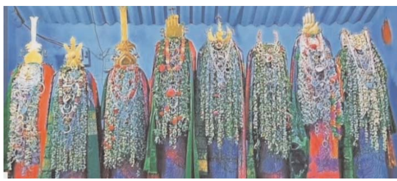
పెద్దపల్లి ప్రతినధి, అడ్వేన్ సమాచార, జూన్ 17:

తెలంగాణ సంస్కృతిలో ప్రత్యేక స్థానమున్న మొహరం వేడుకలు బుధవారం నుంచి గ్రామాల్లో ఘనంగా ప్రారంభమయ్యాయి. హాసన్, హుస్సేన్ వీరత్వానికి ప్రతీకగా నిర్వహించే ఈ వేడుకలు కులమతాలకు అతీతంగా ప్రతి సంవత్సరం భక్తిశ్రద్ధలతో జరుపుకోవడం ఆనవాయితీ. మొహరం నెల మొదటి తేదీ నుంచి పదో తేదీ వరకు జరిగే ఈ వేడుకల్లో తొలి రోజు ఆయా ఆశ్రమాల్లో దేవుల సమీపం పీఠాలను ప్రతిష్ఠిస్తారు. ఐదో రోజు పీఠాల వద్ద గుండం ఏర్పాటు చేసి కట్టెలతో మంట వెలిగించి తెలంగాణ జానపద గీతాలతో భక్తులు సందడి చేస్తారు. సాయంత్రం యువకులు మసీదుల వద్దకు చేరుకుని గుండం చుట్టూ పాటలు పాడుతూ సంప్రదాయ కార్యక్రమాలు నిర్వహిస్తారు. ఎనిమిదో రోజు చిన్న సరస్వతి సందర్భంగా పీఠాలను గ్రామంలో ఊరేగించి తిరిగి ఆశ్రమాల్లో ప్రతిష్ఠిస్తారు. తొమ్మిదో రోజు బెల్లం పానకం తయారు చేసి కొత్త మట్టికండ్లలో నింపి దేవుల వస్తువులతో మసీదుల వద్దకు తీసుకువెళ్లి పీఠాలకు సమర్పిస్తారు. పదో రోజు పెద్ద సరస్వతి సందర్భంగా పీఠాలను భారీ ఎత్తున గ్రామ వీధుల్లో ఊరేగిస్తారు. భక్తులు పీఠాలకు దర్శిలు, కుడుకలు సమర్పించి మొక్కులు చెల్లించుకుంటారు. అనంతరం పీఠాలను చెరువుల వద్దకు తీసుకువెళ్లి శాంతింపజేస్తారు. ఈ వేడుకల్లో అన్ని పధాల ప్రజలు పాల్గొని సామరస్యాలకు ప్రతీకగా మొహరం పండుగను ఘనంగా నిర్వహించుకుంటారు.