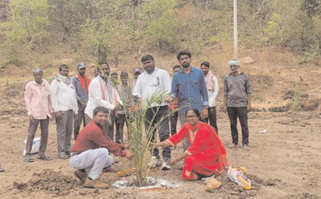
పామాయిల్ గెలలను ప్రభుత్వం నిర్ణయించిన ధరకు కంపెనీలు కొనుగోలు చేసి, ఏడు రోజుల్లోనే రైతుల ఖాతాల్లో నగదు జమ చేస్తున్నాయని తెలిపారు. ప్రస్తుతం పామాయిల్ గెలల ధర మెట్రీక్ టన్నుకు రూ. 23,852గా ఉందన్నారు. ఒక్క మొక్కకు రూ. 20 చెల్లించి, ఎకరానికి రూ. 1,140తో దరఖాస్తు చేసుకోవచ్చని వివరించారు. పామాయిల్ పంట మూడున్నర సంవత్సరాల తర్వాత దిగుబడికి వస్తుందని, మొక్కల మధ్య సుమారు 9 మీటర్ల దూరం ఉండటంతో ఆ ఖాళీ ప్రదేశంలో