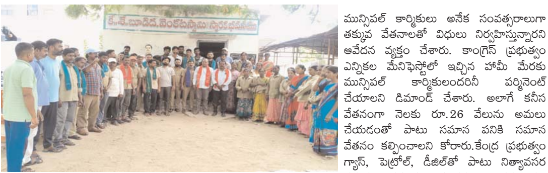
పెద్దపల్లి ప్రతినిధి, అడ్వేట్ సమాచార, జూన్ 13

రూ.26 వేల కనీస వేతనం అమలు చేయాలి: సీబిటియూ నాయకులు