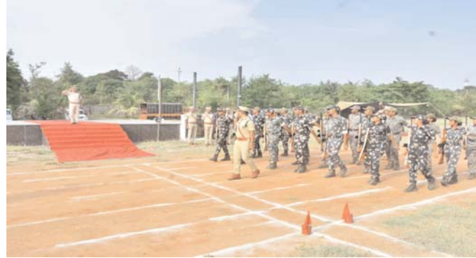
పెద్దపల్లి ప్రతినిధి, అడ్వేన్ సమాచార, జూన్ 12

కోసం కమిషనరేట్ పరిధిలో తరచూ వైద్య శిబిరాలు నిర్వహిస్తున్నామని, త్వరలో మరో మెగా మెడికల్ క్యాంపును కూడా ఏర్పాటు చేయనున్నట్లు తెలిపారు. వివిధ వైద్య నిపుణులను అందుబాటులోకి తీసుకువచ్చి సిబ్బందికి మెరుగైన ఆరోగ్య సేవలు అందించేందుకు చర్యలు తీసుకుంటున్నామని చెప్పారు. మహిళా పోలీస్ అధికారులు, సిబ్బంది పరేడ్ లో