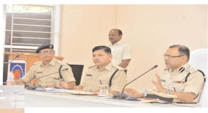
పెద్దపల్లి ప్రతినిధి, అడ్వేన్ సమాచార, జూన్ 12

పోలీస్ సిబ్బంది సంక్షేమం, సమస్యల పరిష్కారానికే పోలీస్ దర్బార్ కార్యక్రమమని, ప్రతి శనివారం కమిషనరేట్ లో పోలీస్ సిబ్బందిని కలుస్తామని రామగుండం పోలీస్ కమిషనర్ అంబర్ కిషోర్ రూపా తెలిపారు. శుక్రవారం రామగుండం కమిషనరేట్ హెడ్ క్వార్టర్స్ లో ఏఆర్ సిబ్బంది, అధికారుల కోసం పోలీస్ దర్బార్ కార్యక్రమం నిర్వహించారు. ఈ కార్యక్రమానికి హాజరైన