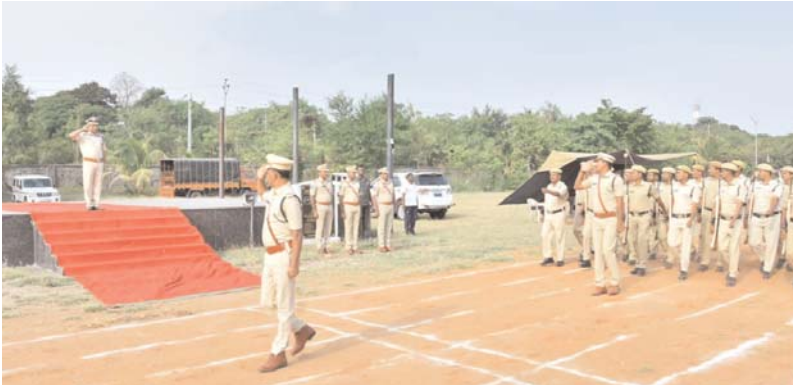
పెద్దపల్లి ప్రతినిధి, అడ్వేన్ సమాచార, జూన్ 12