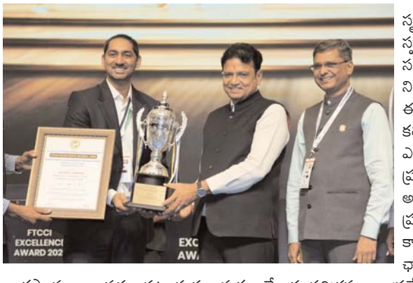
భారత్ స్వామ్యం కావడం పట్ల హర్షం వ్యక్తం చేశారు. పరిశ్రమల స్థాపన, నూతన ఆవిష్కరణలు, భారీ పెట్టుబడుల ఆకర్షణతో పాటు యువతకు పెద్ద ఎత్తున ఉపాధి అవకాశాలను కల్పించేందుకు పూర్తి మద్దతునిచ్చే పర్యావరణ వ్యవస్థను

హైదరాబాద్ వేదికగా ఎఫ్ డీసీసీఐ ఎక్సలెన్స్ అవార్డ్స్ - 2026 ప్రధానోత్సవ కార్యక్రమం అత్యంత ఘనంగా జరిగింది. ఈ ప్రతిష్టాత్మక కార్యక్రమంలో రాష్ట్ర ప్రభుత్వ ప్రతినిధులు పాల్గొని పారిశ్రామికవేత్తలు, ఆవిష్కర్తలు మరియు వ్యాపార దిగ్గజాలకు అవార్డులు ప్రధానం చేశారు. ఈ సందర్భంగా వారు మాట్లాడుతూ.. తెలంగాణ రాష్ట్ర ప్రగతిలో, ఆర్థిక ఎదుగుదలలో పారిశ్రామికవేత్తలు, ఆవిష్కర్తలు, పరిశ్రమల అధినేతలు చూపుతున్న చొరవ, వారు సాధిస్తున్న విజయాలు ఎంతో స్ఫూర్తిదాయకమని కొనియాడారు. ఈ కార్యక్రమంలో