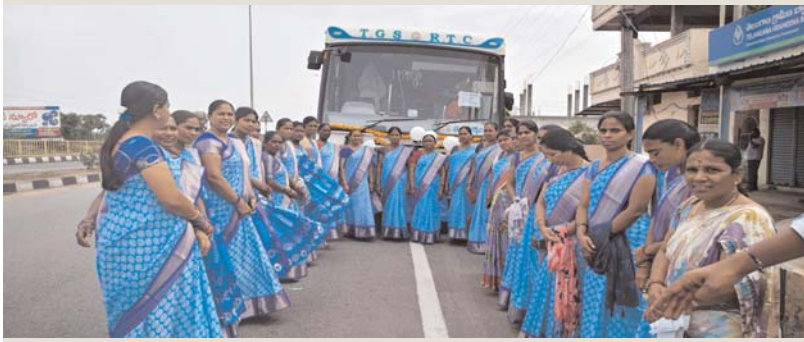
అడ్డపల్లి సమాచారం జూన్ 08 మంచిర్యాల జిల్లా ప్రతినీధి:

జైపూర్ మండలం లోని మహిళా సమాఖ్య మహా లక్ష్మీ మండల లోని మహిళల సాధికారత, స్వయం సహాయక సంఘాల అభివృద్ధి మరియు ప్రభుత్వ సంక్షేమ పథకాలపై అవగాహన కల్పించేందుకు ఏర్పాటు చేసిన మహిళా సమాఖ్య ప్రత్యేక బస్ ప్రారంభోత్సవ కార్యక్రమానికి జైపూర్ మండల మహిళా సమాఖ్య సభ్యులు ఉత్సాహంగా బయలుదేరారు. ఈ సందర్భంగా మహిళా సంఘాల నాయకులు, సభ్యులు మాట్లాడుతూ మహిళల ఆర్థిక అభివృద్ధికి ప్రభుత్వం చేపడుతున్న కార్యక్రమాలను గ్రామీణ ప్రాంతాలకు చేరవేయడంలో ఈ ప్రచార బస్సు కీలక పాత్ర పోషిస్తుందని తెలిపారు. స్వయం సహాయక సంఘాల బలోపేతం, మహిళలకు ఉపాధి అవకాశాల కల్పన, ఆర్థిక స్వావలంబన సాధన లక్ష్యంగా ఈ కార్యక్రమం నిర్వహిస్తున్నట్లు పేర్కొన్నారు. జైపూర్ మండలంలోని వివిధ గ్రామాల మహిళా సంఘాల ప్రతినీధులు పెద్ద సంఖ్యలో పాల్గొని ప్రారంభోత్సవ కార్యక్రమానికి హాజరయ్యారు. ప్రత్యేక బస్సులో బయలుదేరారు. మహిళల అభివృద్ధి కుటుంబ, సమాజ అభివృద్ధికి వూరి అని, ప్రభుత్వం అందిస్తున్న అవకాశాలను ప్రతి మహిళ సద్వినియోగం చేసుకోవాలని ఈ సందర్భంగా పిలుపునిచ్చారు. ఈ కార్యక్రమంలో మండల మహిళా సమాఖ్య నాయకులు, గ్రామ సంఘాల సభ్యులు, సీసీలు, పీఠీపిలు మరియు మహిళా సంఘాల ప్రతినీధులు పాల్గొన్నారు.