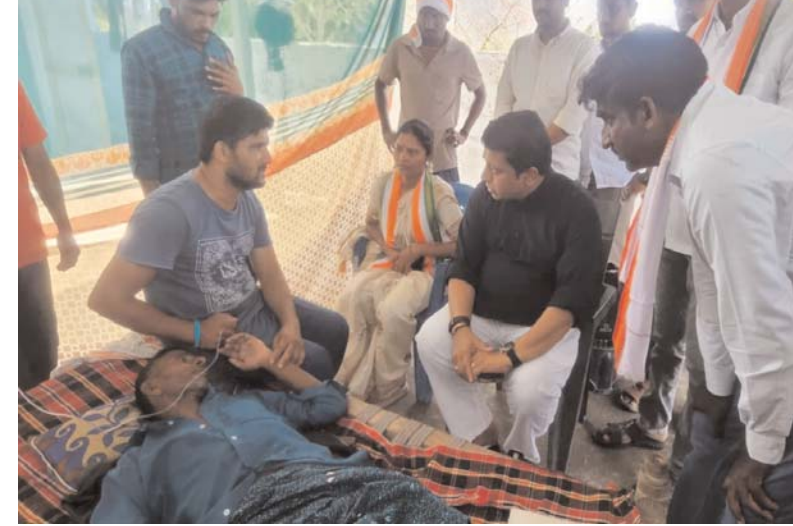
మత్తయ్యను కూడా కలిసి ఆరోగ్య పరిస్థితిపై వివరాలు తెలుసుకుని అవసరమైన సహాయ సహకారాలు అందిస్తామని భరోసా ఇచ్చారు. ఈ కార్యక్రమంలో స్థానిక నాయకులు, కార్యకర్తలు మరియు గ్రామస్తులు పాల్గొన్నారు.