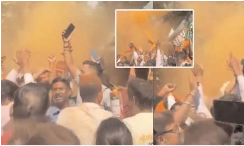
కోల్కతా: అర్జున్ సమాచారమ్ ప్రతినధి

పశ్చిమ బెంగాల్, అస్సాం, పుదుచ్చేరి అసెంబ్లీ ఎన్నికల ఫలితాల్లో విజయం దిశగా బీజేపీ దూసుకుపోతోంది. అస్సాంలో గత రెండు అసెంబ్లీ ఎన్నికల్లోనూ బీజేపీనే విజయ ధంకా మోగించగా.. తాజాగా మూడోసారి విజయకేతనం ఎగరేస్తోంది. మొత్తం 126 స్థానాలకు గాను బీజేపీ 99 స్థానాల్లో అధికారం కనబరుస్తోంది. పశ్చిమ బెంగాల్ లోనూ కమలం పార్టీ సత్తా చాటుతోంది. మొత్తం 294 స్థానాలకు గాను 197 సీట్లలో బీజేపీ ముందంజలో ఉంది. మమతా బెనర్జీ నేతృత్వంలోని టిఎస్ కేవలం 93 స్థానాల్లోనే అధికారం ప్రదర్శిస్తోంది. దీంతో పశ్చిమ బెంగాల్ లో బీజేపీ విజయం దాదాపు ఖాయమైపట్టు కనిపిస్తోంది. ఈ సందర్భంగా అస్సాం, పశ్చిమ బెంగాల్ రాష్ట్రాల్లో, అలాగే దేశవ్యాప్తంగా బీజేపీ శ్రేణుల సంబరాలు అంబరాన్ని అంటుతున్నాయి. కాషాయ దుస్తుల్లో రోడ్లపైకి వచ్చిన ఆ పార్టీ నేతలు, కార్యకర్తలు సంతోషం వ్యక్తం చేస్తున్నారు. డీజే పాటలకు నృత్యాలు చేస్తూ రంగులు పూసుకుంటున్నారు. స్ట్రీట్లు తినిపించుకుంటూ, టపాసులు కాలుస్తూ సంబరాలు చేసుకుంటున్నారు. ముఖ్యంగా కోల్కతాలోని పార్టీ ప్రధాన కార్యాలయం వద్దకు కార్యకర్తలు భారీగా తరలివచ్చారు. రాష్ట్రవ్యాప్తంగా నేతలు అక్కడే ఉన్నారు. కాషాయ వస్త్రాలు ధరించిన వారంతా సంప్రదాయ బెంగాలీ సంగీతానికి నృత్యాలు చేస్తున్నారు. చౌరా వంటన వద్దకు భారీగా చేరుకున్న కమలం శ్రేణులు జై శ్రీరామ నినాదాలతో చోరంతించారు. అలాగే రాష్ట్రవ్యాప్తంగా వివిధ ప్రాంతాల్లో కార్యకర్తలు సంబరాలు చేసుకుంటున్నారు.